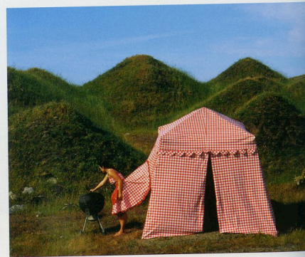
© 2008, Robin Lasser + Adrienne Pao