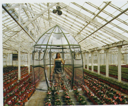
© 2008, Robin Lasser + Adrienne Pao