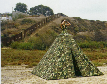
© 2008, Robin Lasser + Adrienne Pao